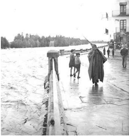
Figura 1. Imatge de portada de l'exposició «Conviure amb la por: 1938: el cap de pont de Balaguer».

l'establiment del cap de pont de Balaguer durant la Guerra Civil espanyola presentant una exposició que tenia com a motiu central els fets que succeïren durant els mesos anteriors i posteriors a l'entrada de l'exèrcit del general Franco a la ciutat de Balaguer (Figura 1). Això va permetre al Camp d'Aprenentatge de la Noguera col·laborar en l'elaboració d'uns materials didàctics per a educació primària i per a educació secundària, adreçats a alumnes que visitessin l'exposició «Conviure amb la por: 1938, el Cap de Pont de Balaguer», i accedir, gràcies a la tasca realitzada pel Museu de la Noguera, a documents inèdits com el dietari de Camilo Cava 6 i la documentació conservada en l'Arxiu comarcal de la Noguera.