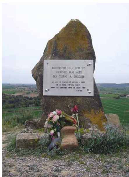
Figura 6. Monòlit commemoratiu de l'Agrupació de Supervivents de la Lleva del Biberó al capdamunt del Merengue, 1985.

B.3 Cal recuperar la memòria històrica? L'any 1985 l'Agrupació de Supervivents de la Lleva del Biberó va alçar un monòlit commemoratiu al capdamunt del Merengue on hi ha escrit: «Recordem-ho sempre perquè mai més torni a succeir». Això permet plantejar a l'alumnat la reflexió sobre si cal i per què recuperar la memòria de la Guerra Civil (Figura 6).