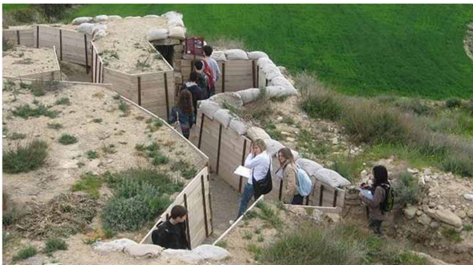
Figura 5. Trinxeres recuperades i musealitzades del Merengue.

de la lleva del biberó davant l'ofensiva del Merengue tenint en compte la instrucció que havien rebut i les armes per realitzar l'ofensiva, considerant que al seu davant tenien l'elit de l'exèrcit franquista, com eren els tiradors d'Ifni (Figura 5). Plantejar a l'alumnat com afrontaria aquesta situació i, després, introduir el testimoni d'alguns dels protagonistes que van participar en l'ofensiva del Merengue i com va finalitzar. Establir les conseqüències del fracàs de l'exèrcit republicà en el context de la Guerra Civil espanyola.