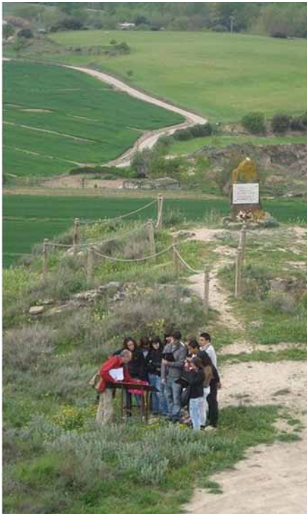
Figura 3. Alumnes de quart d'ESO observant els plafons informatius d'on estaven localitzades les tropes en l'ofensiva del cap de pont de Balaguer del 22 al 29 de maig de 1938.

Les activitats didàctiques proposades a l'espai de memòria del Merengue promouen l'ús de fonts materials com a eina d'anàlisi històrica. Així mateix, pretenen presentar de manera sintètica els fets que van tenir lloc a la posició defensiva del Merengue i promoure processos d'empatia impli-