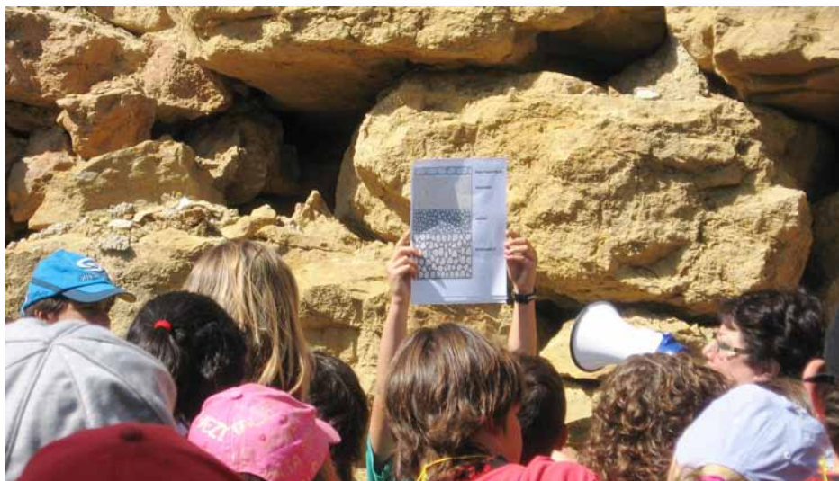
Figura 6. Explicacions durant l'itinerari realitzat des del Coll d'Àger fins a la població, tot seguint l'antiga via romana.

La valoració per part dels alumnes és molt bona, s'han adonat que tenen a prop monuments tan importants o més que els que estudiem als llibres de text. Els mestres també ho valorem molt positivament, ja que ens ha servit per assolir uns aprenentatges amb els alumnes d'una manera molt més participativa. Les famílies i els ajuntaments també han expressat la seva satisfacció pel fet que valoréssim algun element del seu poble i, a més a més, els pares estan molt satisfets amb l'interès que mostren els seus fills pel projecte i els resultats dels treballs.