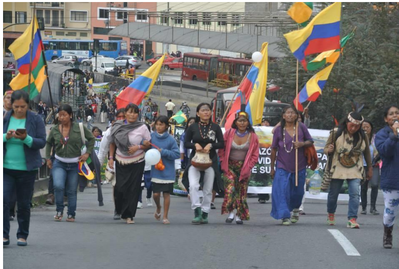
Figura 3: La marcha de las Mujeres Amazónicas en Quito, octubre 2013.

Por último, quiero destacar que en el caso de las defensoras de la naturaleza, las escalas de opresión por parte de actores heterogéneos dentro y fuera de las comunidades se multiplican. En este sentido, se trata de subjetividades que, por un lado, se oponen al avance de las fuerzas del capitalismo neoliberal sobre sus cuerpos y territorios; por otro lado, desafían las barreras patriarcales dentro de las comunidades, llegando a ocupar roles no tradicionales. Itaya me informa que a menudo se les etiqueta como “malas mujeres”, che intentan violar la normatividad impuesta (García Torres, 2017). Al respecto, de acuerdo con Ulloa (2016), es posible afirmar que las mujeres defensoras han sido criminalizadas y asesinadas por sus demandas y reivindicaciones, y hoy en día sufren violencias y agresiones físicas, psicológicas, simbólicas y culturales que a menudo permanecen en la oscuridad por la complicidad de los agresores (véase Marotta, 2021).