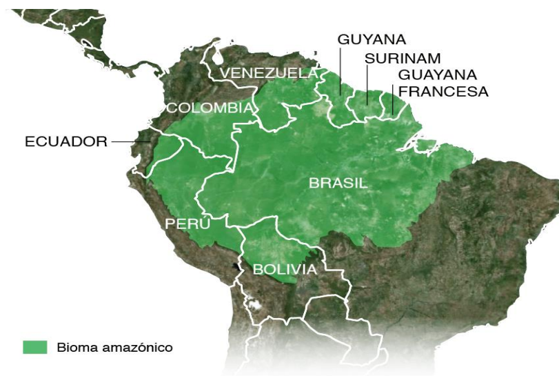
Figura 1: Territorio que ocupa la Amazonía en los países donde se extiende.

Desde 2007, con la elección de Rafael Correa, cuyo gobierno forma parte del ciclo progresista latinoamericano, la RAE ha conocido un incremento de las actividades extractivas que incluyen la ampliación de la frontera petrolera en el centro-sur, la penetración de la minería a gran escala, la expansión de proyectos hidroeléctricos, la construcción de carreteras y la deforestación (López et al., 2013). Este proceso se inscribe en el proyecto de modernización y desarrollo nacional, en el que el aumento de la actividad extractiva se considera un medio necesario para la acumulación y redistribución de riqueza a favor de la disminución de la tasa de pobreza del país (Gudynas, 2012; Burchardt & Dietz, 2014; Svampa, 2019). Fue en 2012, con la inauguración de la XI Ronda Petrolera o Ronda Suroriente, cuando después de 16 años tuvo lugar la licitación de 21 Bloques petroleros –que cubren el 76% de los territorios indígenas ancestrales– en el suroriente de la Amazonía. A partir de ese momento, los derechos de la población indígena y los territorios que ésta habita se ven amenazados en nombre de una “nueva era petrolera”, cuyo objetivo es potenciar la extracción de petróleo dada su preeminencia en la exportación nacional.