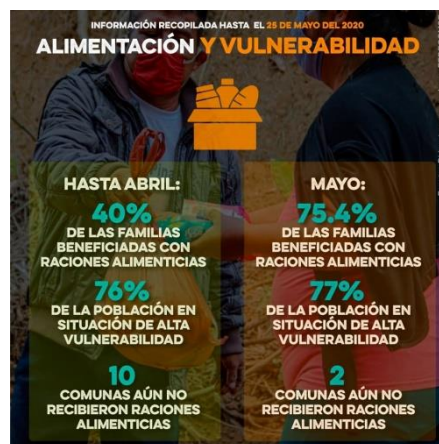
Imagen 1: Ficha gráfica: Alimentación y vulnerabilidad en las Comunidades de Santa Elena.

Más allá de esto, la intención ha sido convertir la información en una herramienta para que las comunidades pudieran reclamar mayor atención y vieran reflejada su realidad en resultados de fácil comprensión. Por lo tanto, se creó un grupo de WhatsApp con todos los dirigentes y/o presidentes comunales para compartir la información levantada, generando un espacio de intercambio entre investigadores y dirigentes comunales. En la decisión de compartir los datos, también se consideró el hecho de que esta red es la más usada entre los comuneros y dirigentes. Con la ayuda de una diseñadora gráfica, se crearon varias fichas gráficas y cartografías que permitieron presentar la información de una manera visual resumida, centrada en los datos esenciales; número de las Comunas en las que se levantó la información, habitantes, familias, número de fallecidos y de personas diagnosticadas con COVID; porcentaje de familias en situación de alta vulnerabilidad, porcentaje de familias que recibieron raciones alimenticias, datos sobre la infraestructura y servicios existentes, y las acciones que se llevaron a cabo desde la autogestión comunal y comunitaria.