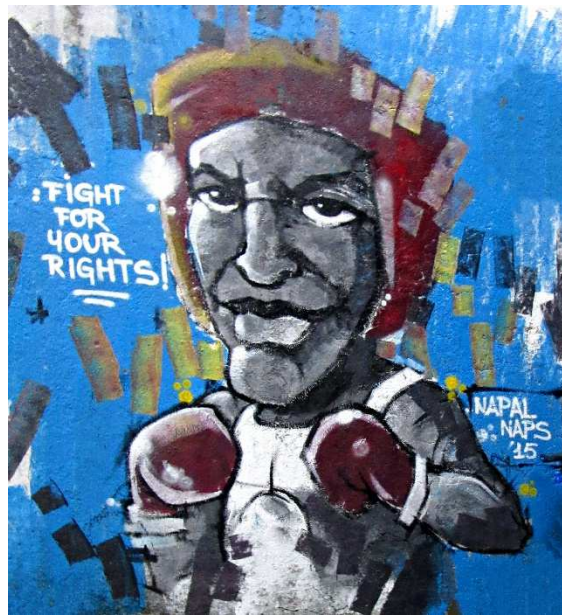
Figura 1: Boxeador, "Lucha por tus derechos".

Sin embargo, decíamos, las formaciones políticas de izquierdas han percibido negativamente, desde el principio, la adhesión a esta nueva práctica por parte de sus militantes. Como si esta adhesión decretara, en cierto modo, una desconexión homológica entre el habitus (político) y la práctica social.