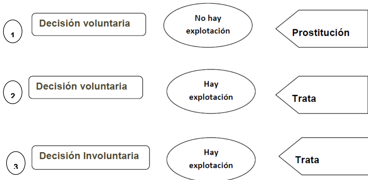
Fig. 1. Esquema de diferenciació entre trata y prostitució. Elaboració pròpia.

revistes.uab.cat/periferia - www.periferia.name