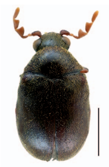
Figura 1. Hàbitat del mascle de Dorcatoma (Dorcatoma) punctulata del Tillar (Tarragona). Escala = 1 mm.