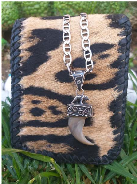
Imagen 2. Cartera confeccionada con piel de jaguar y una garra de oso