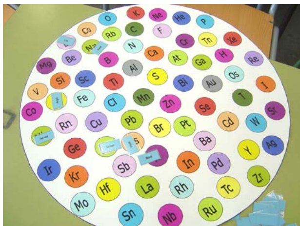
Figura 7. El linx.

Cada jugador agafa tres targetes amb noms d'elements i les disposa del revés sobre la taula. Quan tots els jugadors les tinguin, cadascú les gira i les posa sobre el taulell damunt del símbol corresponent a l'element. El jugador que acabi abans guanya les tres targetes i els altres només les que hagin col·locat. Les targetes sense col·locar es tornen. El procés es repeteix fins que s'acaben les targetes.