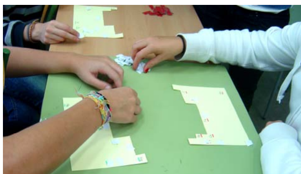
Figura 4. TP bingo.

Un jugador té una bossa amb targetes amb el nom dels elements químics i els va cantant un a un. La resta de jugadors col·loquen una fitxa al símbol de l'element cantat si surt en el cartonet que tenen amb forma de taula periòdica. Quan un jugador ha completat la seva taula canta bingo i guanya.