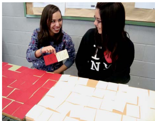
Figura 5. Jugant al Memory.