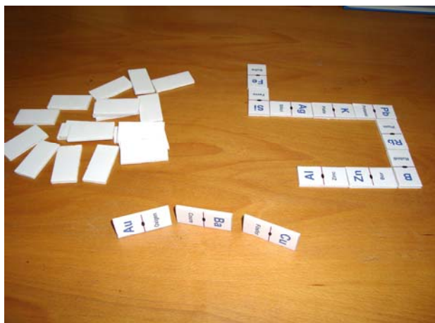
Figura 6. Dòmino.

Són les del dòmino però en aquest cas s'han d'aparellar noms i símbols.