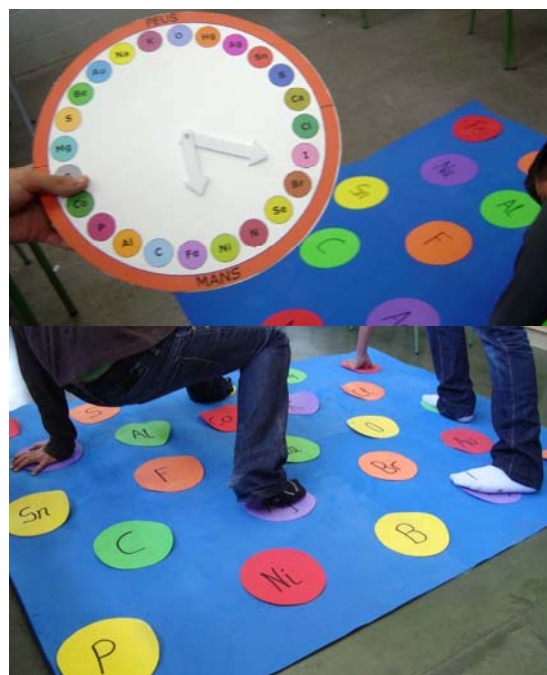
Figura 3. A dalt, ruleta. A sota, jugant al Twister.