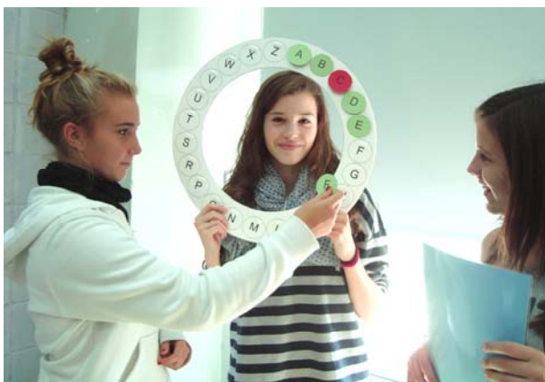
Figura 1. Jugant al Passaelements.

Quan s'acaben les lletres es comptabilitza el nombre d'encerts. Guanya el jugador que completi la rodona correctament o el que hagi obtingut més rodones verdes.