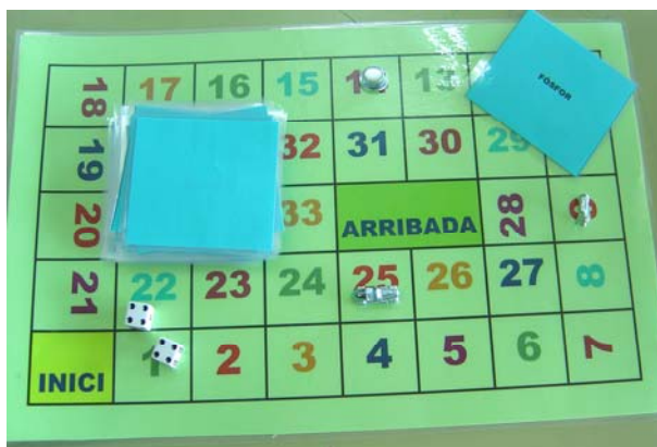
Figura 9. La gran cursa dels elements.