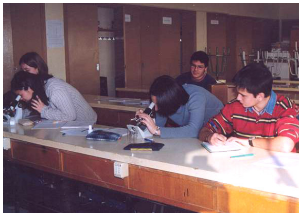
Figura 1. Alumnes treballant al laboratori durant les activitats de la Setmana de la Ciència.