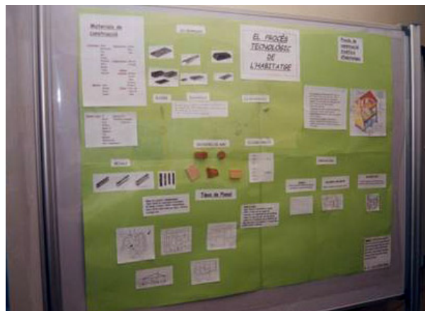
Figura 2. Un dels pòsters fets pels alumnes en el marc del congrés.

Pòsters científics: A l'entrada del centre i en alguns dels seus passadissos es col·loquen panells perquè l'alumnat hi posi, en forma de pòsters, els seus treballs científics. Els pòsters els fan de forma individual o en grups de classe ambdós tutoritzats per un professor/a de ciències i poden tractar diferents vessants: treballs d'experimentació i/o investigació (sempre al seu nivell), història de la ciència, biografies de científics o bé sobre el medi ambient... entre d'altres.